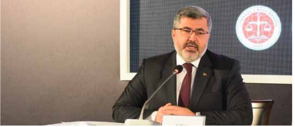
Av. Ali Özkaya