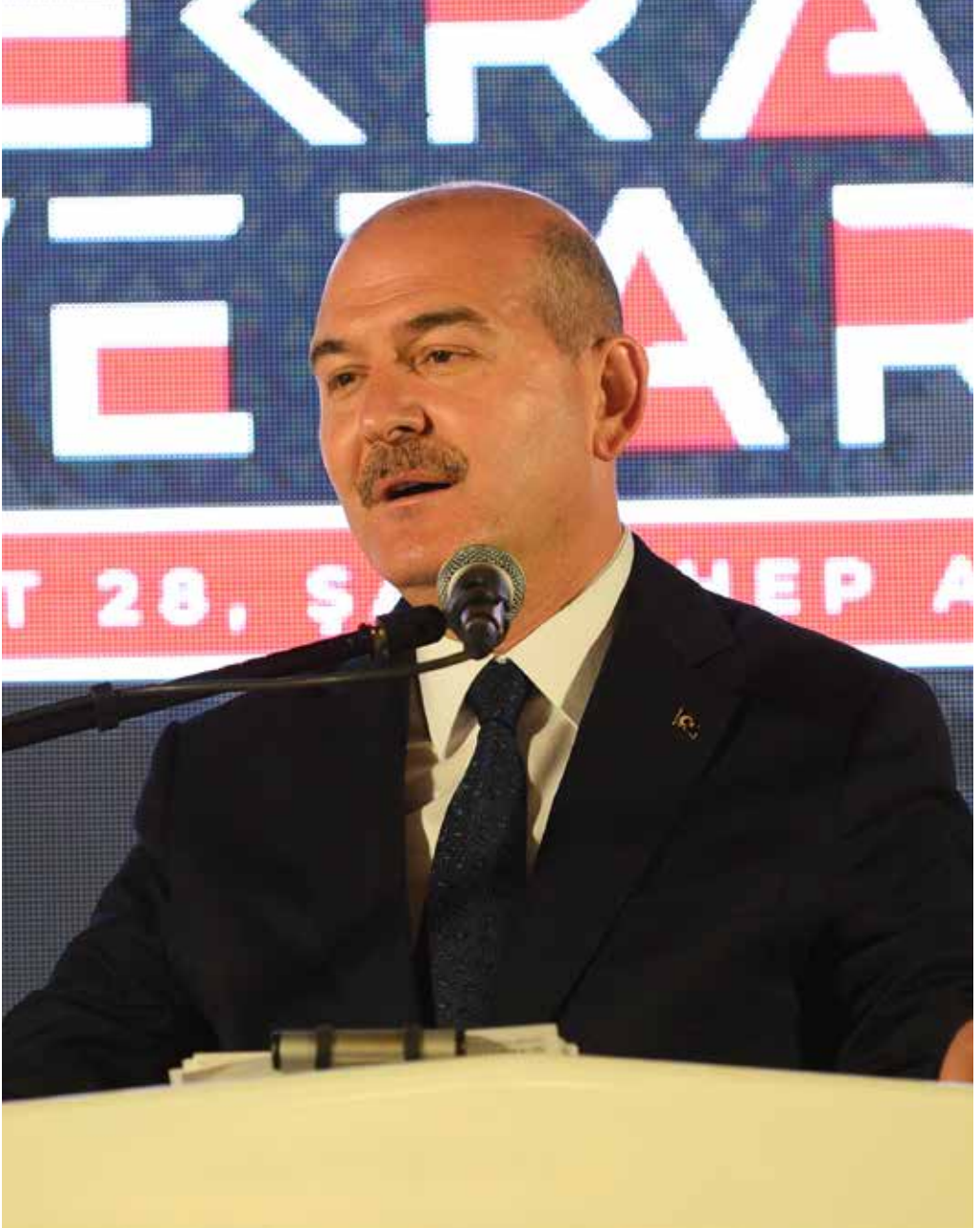
Süleyman Soylu - T.C. İçişleri Bakanı