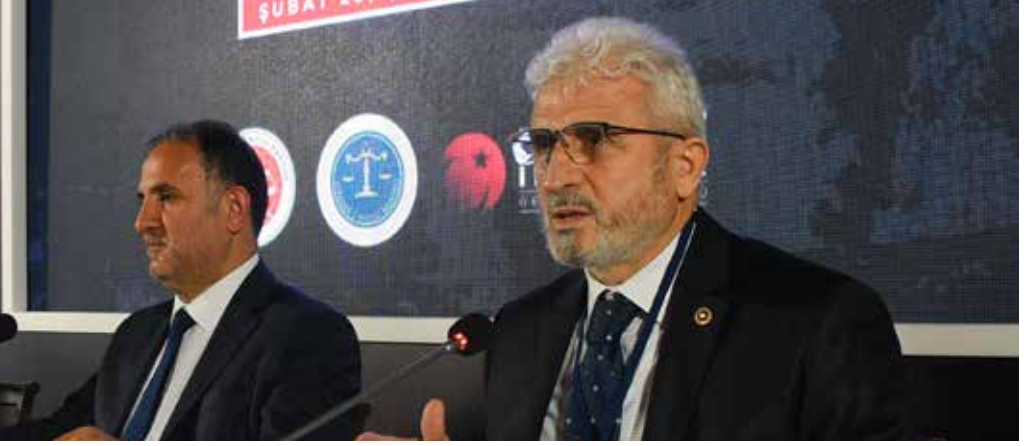
Av. Hüsni Tuna